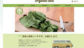
掲載作品は、全て過去の訓練生作品