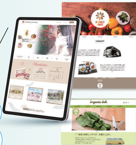
掲載作品は、全て過去の訓練生作品

企業実習を経験して仕事内容を知りたい! 就職前に、業界や職種について知るチャンス!