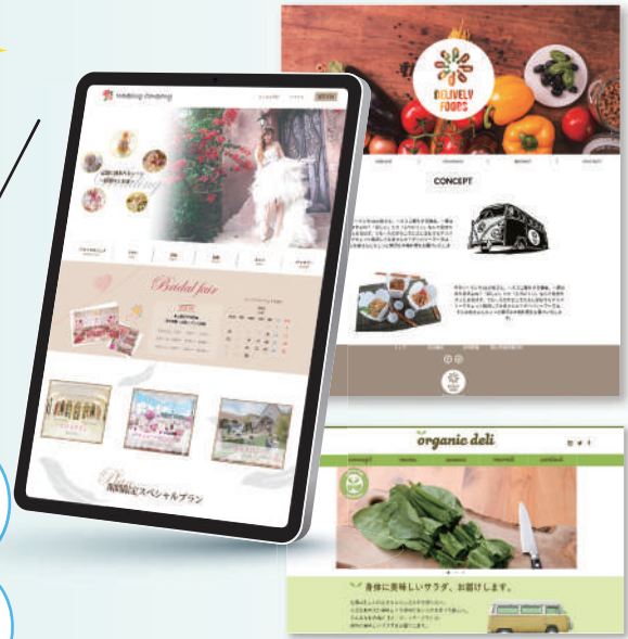
掲載作品は、全て過去の訓練生作品

募集期間 令和6年4月11日(木)~5月10日(金) 募集人数 15人 (最低実施人数:13人 (応募者が少ないときは、訓練を中止する場合があります。))