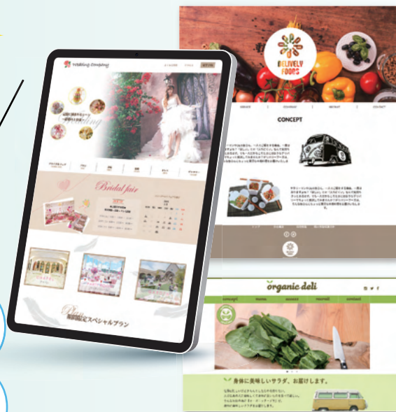
掲載作品は、全て過去の訓練生作品

企業実習を経験して仕事内容を知りたい! 就職前に、業界や職種について知るチャンス!